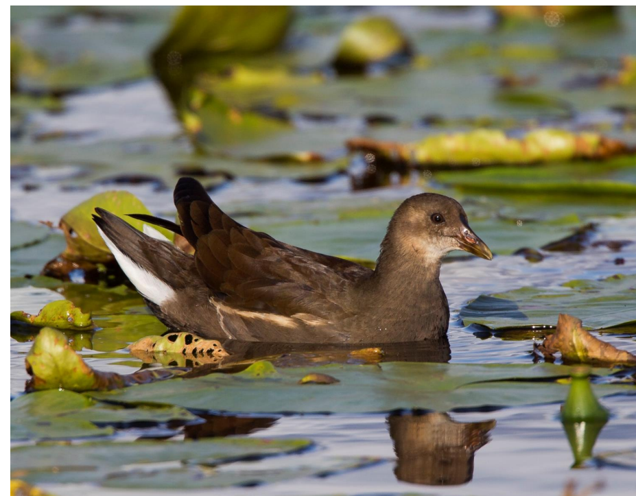
Ung rörhöna i Ödeborgsdammarna 9.8.2012.