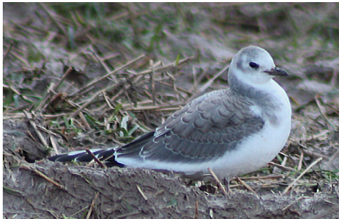
Tärnmås utanför Ödeborg 17.10 2012.