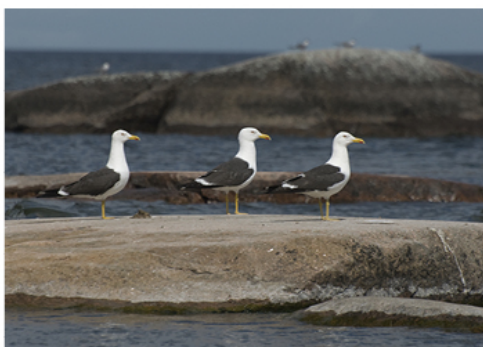
Silltruten häckar sällsynt i några av landskapets skärgårdar.